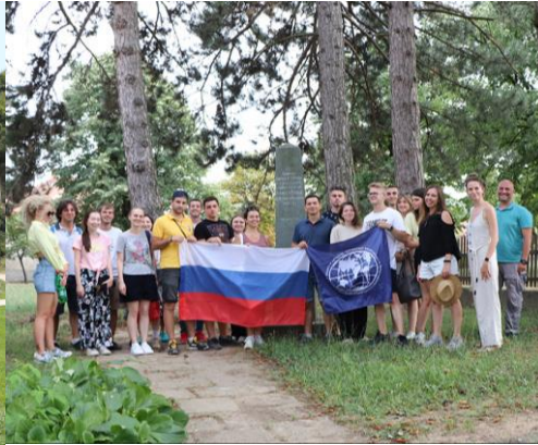
Слика 4. Штубик - споменик руским добровољцима, подигнут 1907. год