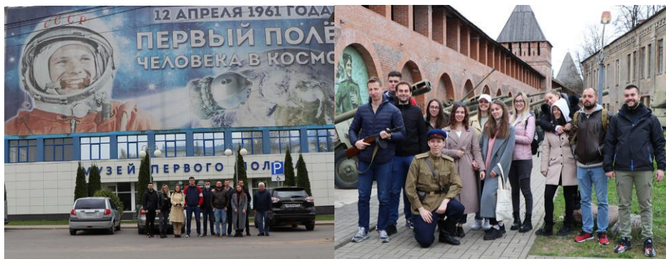
Слика 1. Шести летњи камп Центра Руског географског друштва у Србији Смоленска област и Москва (3-17. мај 2021)

Континуитет у одржавању традиционалних летњих еколошко-географских кампова у организацији Центра руског географског друштва у Србији прекинут је 2020. године услед пандемије коронавируса. Међутим, са побољшањем епидемиолошке ситуације 2021. године реализована су два кампа. Први, на територији Руске Федерације, у Москви и Смоленској области (3-17. мај), а други од 30. јула до 17. августа у Републици Србији. Камп у Смоленској области, према општем мишљењу учесника, сигурно представља један од до сада најбоље припремљених и реализованих активности овог типа.