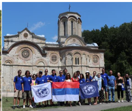
Слика 8. Манастир Љубостиња