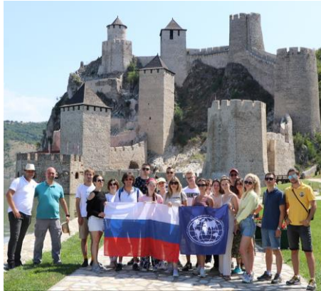
Слика 3. Голубачки град (XIV век)