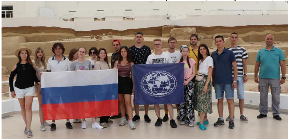
Слика 5. Лепенски вир – изложбена поставка археолошког локалитета