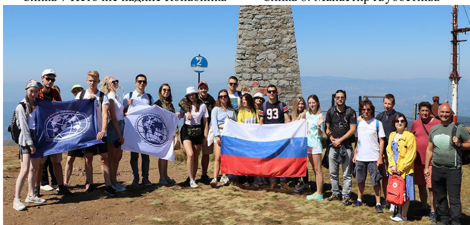
Слика 10. Копаоник– Суво рудиште са Панчићевим врхом (2017 m)