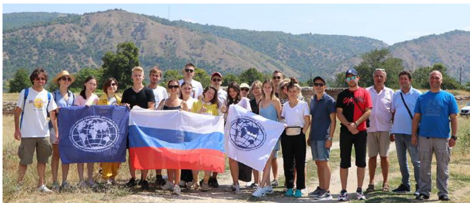
Слика 6. Десна обала Дунава – XE Ђердап I и антички локалитет Дијана