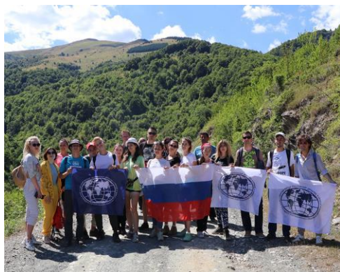
Слика 7 Источне падине Копаоника