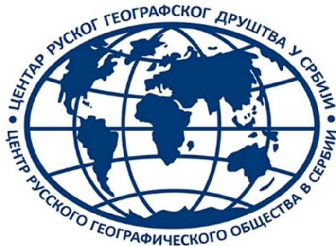
ФОТО АЛБУМ СА СЕДНИЦЕ САВЕТА ЦЕНТРА РУСКОГ ГЕОГРАФСКОГ ДРУШТВА У СРБИЈИ